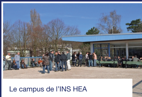
Le campus de l'INS HEA