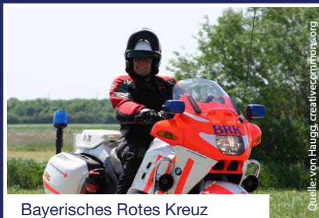
Bayerisches Rotes Kreuz