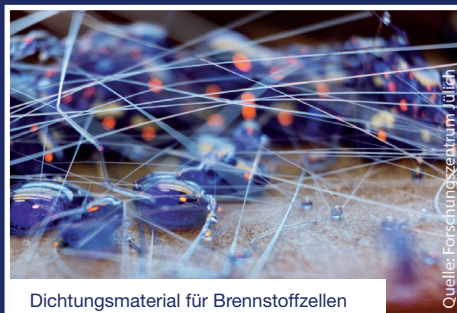
Dichtungsmaterial für Brennstoffzellen