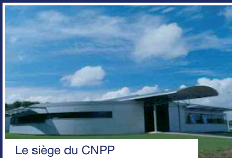
Le siège du CNPP