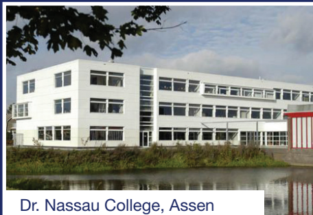
Dr. Nassau College, Assen