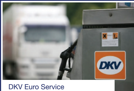
DKV Euro Service