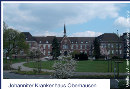
Johanniter Krankenhaus Oberhausen